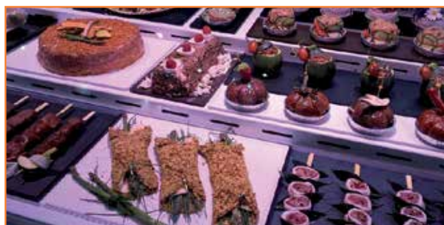
A Alimentària vam mostrar la diversitat d'elaborats que ensenyem a fer als nostres agremiats als cursos de formació del Gremi.