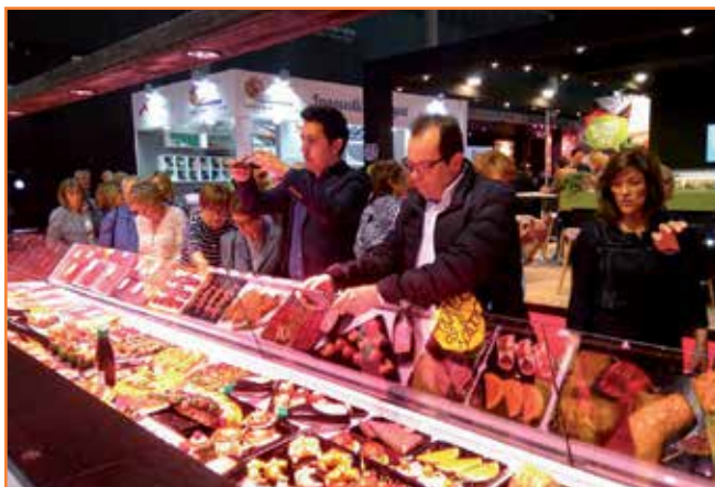
El nostre lineal a Alimentària va atreure a multitud de visitants que es van quedar molt sorpresos amb la posada en escena.

Alimentària va congrega molts visitants experts en el sector carni.