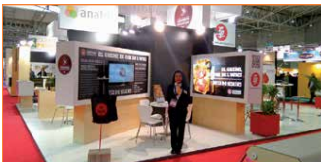
Imatge de l'estand a la Fira Alimentària d'aquest any.