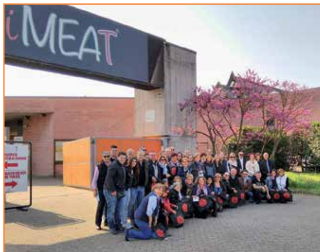
Imatge de tot el grup de carnissers i carnisseres que vam viatjar a Mòdena.

En definitiva, aquest nou viatge a Mòdena ha estat