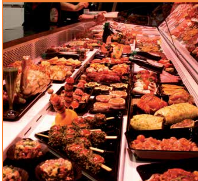
Vista general de la vitrina que vam exposar a Alimentària a l'edició d'aquest any.