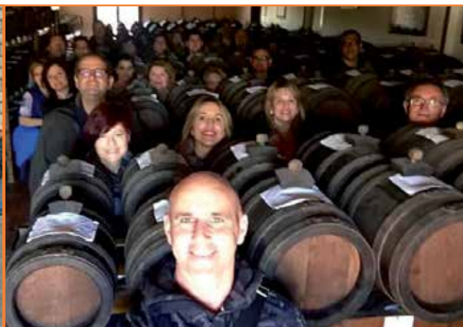
Foto de l'esquerra: visita del grup a Bolonya. A la dreta, moment de l'interessant recorregut a l'Acetaia Leonardí. Abaix, alguns dels elaborats que vam poder veure a la nostra visita a la Fira de Mòdena d'aquest any.