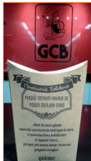
Guardiola Solidària que està present a les Carnisseries participants.

Us detallem les Carnisseries que han fet les entregues aquest segon trimestre i les entitats on s'han entregat: